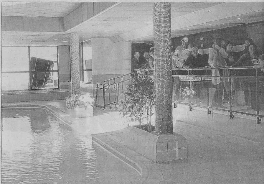
Après les discours, la visite du Carré bleu a attisé la curiosité de l'assistance.

Après le coup de ciseau traditionnel sur le ruban rouge, les 70 personnes présentes ont visité le Carré bleu, constitué d'une succession de pièces formant une déambulation, pour des moments de détente et bien-être. Le lieu est accessible uniquement aux vacanciers du centre. Des espaces fermés, aux lumières douces, alternent avec des espaces vitrés et ouverts sur la nature et la montagne.